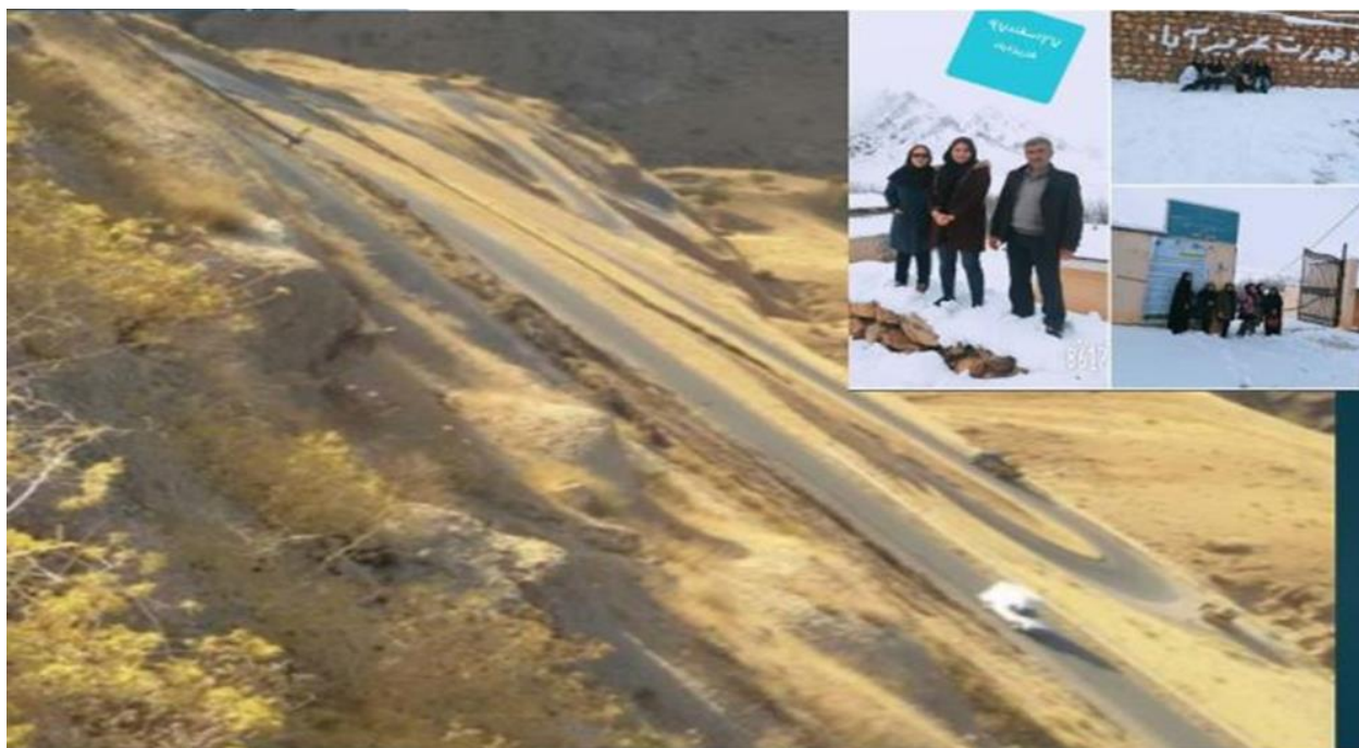
عکس: مسیر دسترسی به خوشه کوهورت روستایی در روستاهای بخش مرکزی در شهرستان اردل و پیچ های سریالایی جاده اردل به دوازده امام در روز آفتابی و روستای عزیزآباد در روز برفی و پرشگران کوهورت در تصویر مشاهده می شوند. فاصله تا مرکز استان بیش از ۳۰۰ کیلومتر رفت و برگشت.